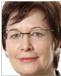
Autorin: Melita Tuschinski Dipl.-Ing./UT, Freie Architektin